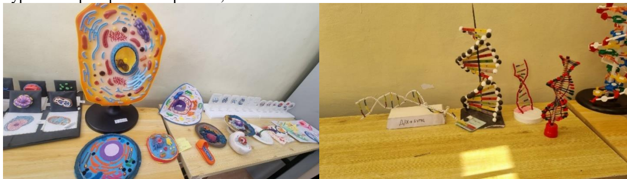
Зураг Оюутнуудын хийсэн микробиологийн хичээлийн үзүүлэн