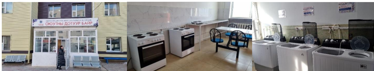
Зураг. Оюутны дотуур байр