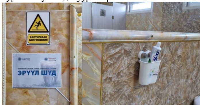
Зураг Эрүүл шүд-Эрүүл ирээдүй аян