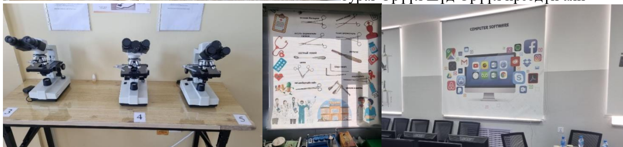
Зураг.Лабораторийн микроскоп, анги танхимын хөшиг