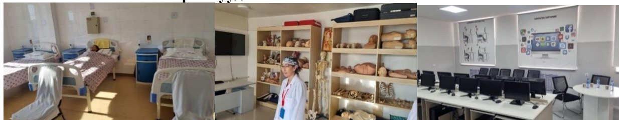
Зураг Сувилахуйн ур чадварын төв, мэдээлэл технологийн кабинет