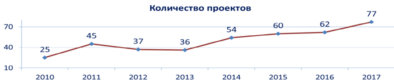
Рисунок 1 – количество научных проектов за 2010-2017 гг