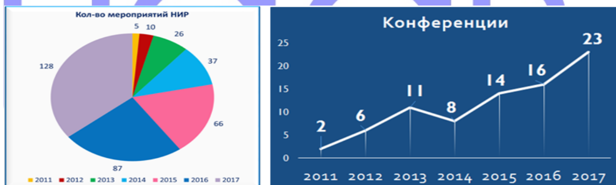
Рисунок 2. Количество научных мероприятий

Благодаря росту научных проектов увеличивается количество мероприятий НИР в формате конференций, круглых столов, семинаров и др., проводимых в университете Туран, на которых представляются и обобщаются полученные результаты (рисунок 3).