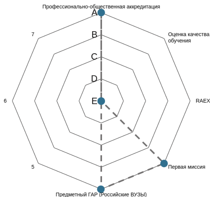
Рисунок 2 – Лепестковая диаграмма (эпюра) оценок Борда