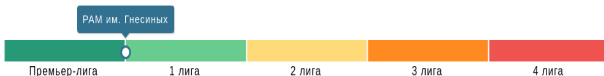
Рисунок 1 – Позиция РАМ им. Гнесиных в ПНАР 2024 по предметной области 53.00.00 Музыкальное искусство

В Предметном национальном агрегированном рейтинге (ПНАР) – 2024 РАМ им. Гнесиных вошел в Премьер-лигу лучших вузов России по предметной области 53.00.00 Музыкальное искусство .