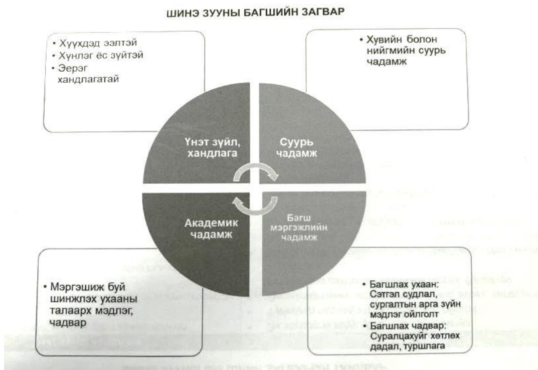
Зураг 1. Шинэ зууны багшийн загвар