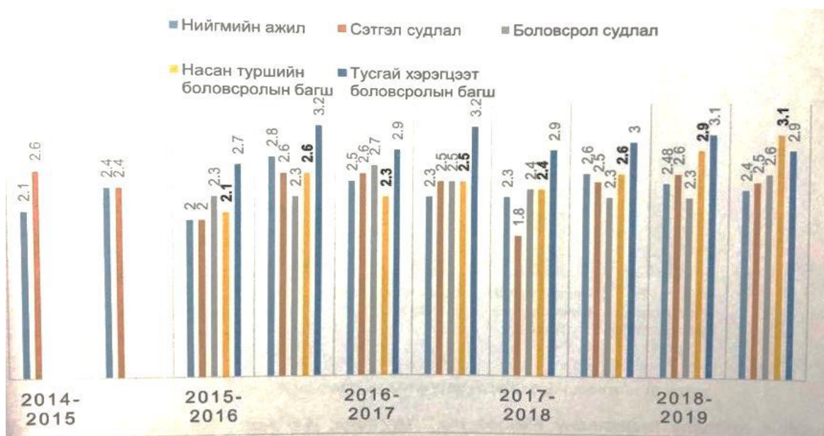
Зураг 1. Оюутнуудын голч дүнгийн харьцуулалт